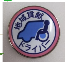
バッジB ピンバッジ