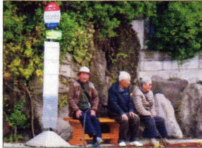
バス利用名人の皆さん

犬山や名古屋方面に行く時は夕方からにしています。電車ですと新鵜沼で必ず「路線バス」に乗れますからね。バスの時刻に合わせて行動をしています。